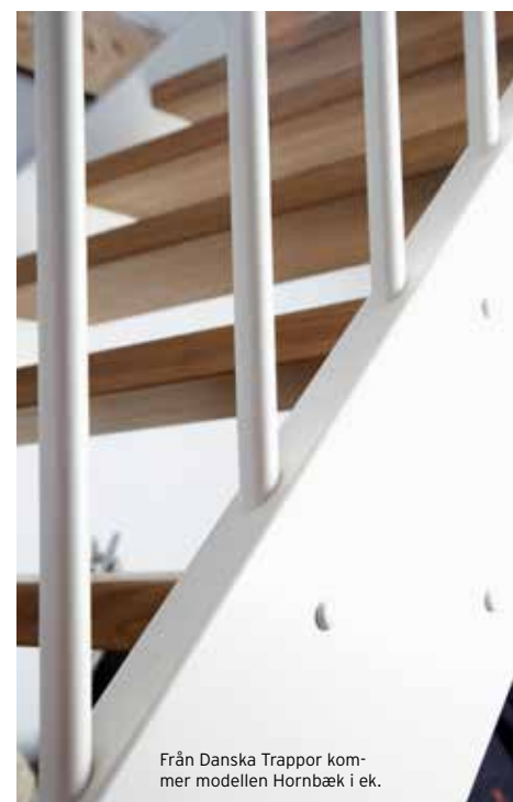
Från Danska Trappor kommer modellen Hornbæk i ek.

husets övriga stil och låta den bestämma vilken variant man ska ha på trappan.