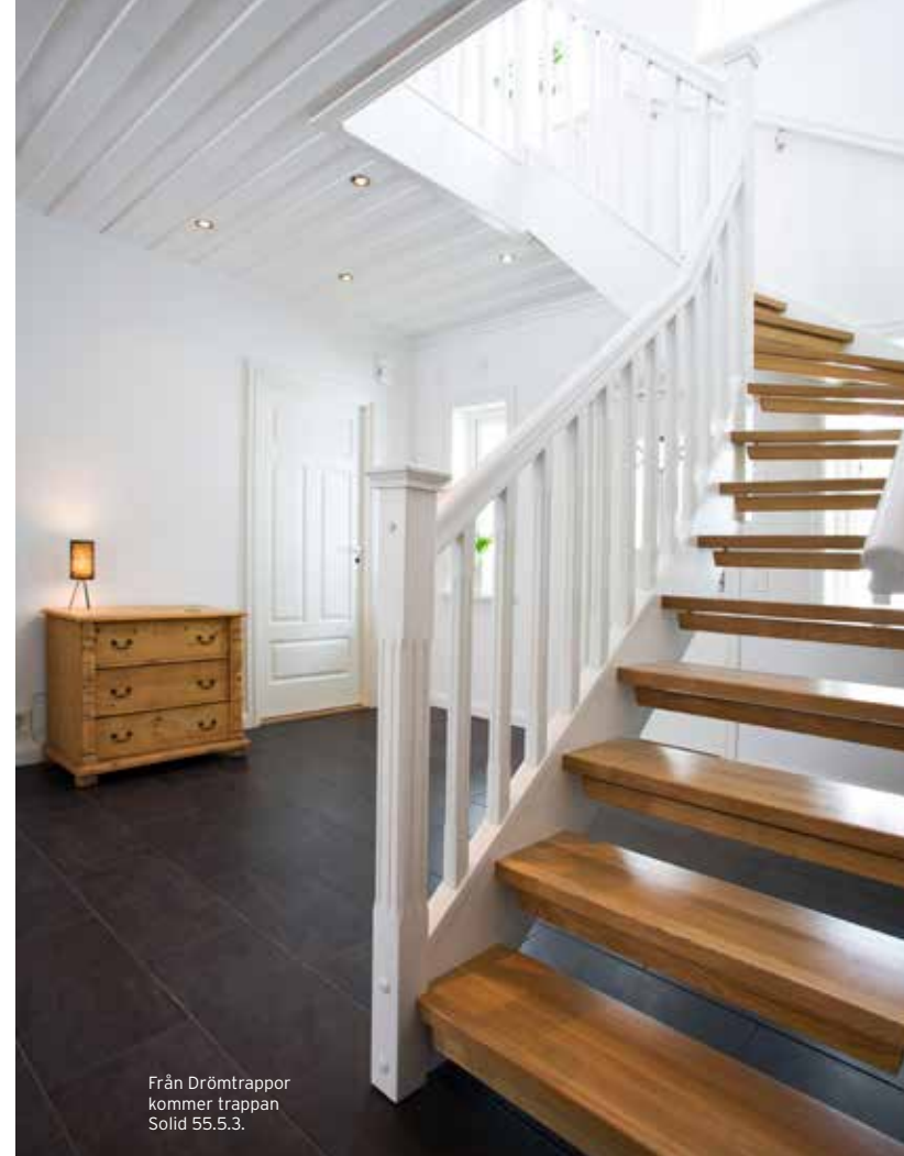
Från Drömtrappor kommer trappan Solid 55.5.3.

Utöver detta bör man även tänka på vem som bor i huset och anpassa säkerheten efter det. Har du barn i familjen bör trappan