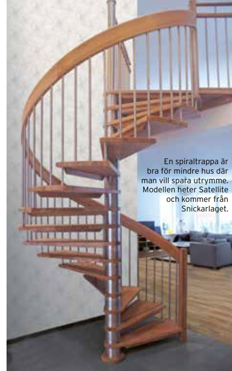
En spiraltrappa är bra för mindre hus där man vill spara utrymme. Modellen heter Satellite och kommer från Snickarlaget.

Att välja rätt trappa handlar också om vilken känsla du är ute efter. Vill du ha en luftig, svävande och elegant trappa eller ska