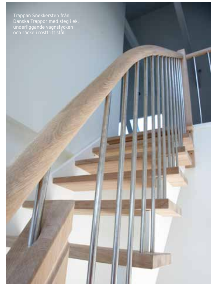
Trappan Snekkersten från Danska Trappor med steg i ek, underliggande vangstycken och räcke i rostfritt stål.