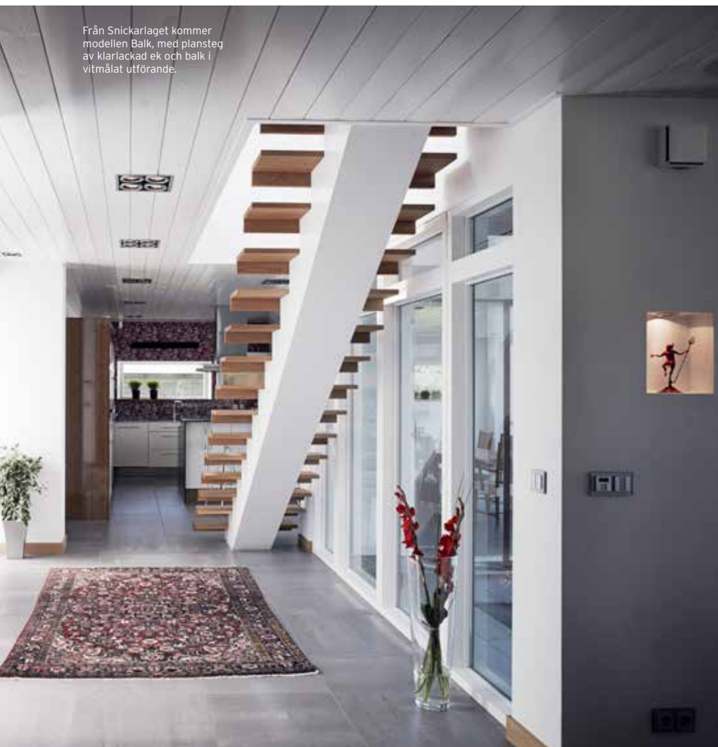
Från Snickarlaget kommer modellen Balk, med plansteg av klarlackad ek och balk i vitmålat utförande.